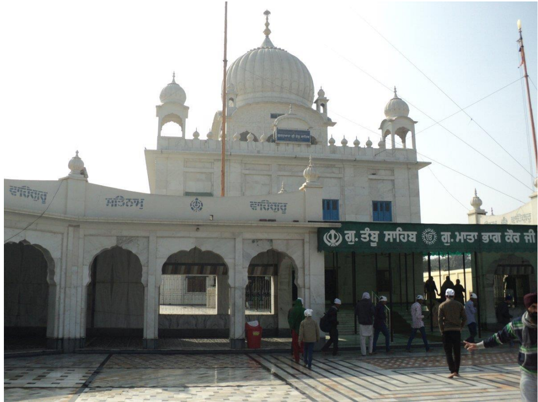
ਗੁਰਦੁਆਰਾ ਤੰਬੂ ਸਾਹਿਬ ਮੁਕਤਸਰ