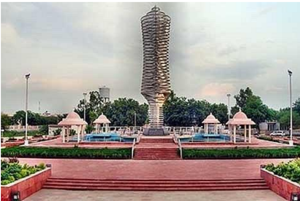
ਮੁਕਤਸਰ ਵਿਚ ਚਾਲ੍ਹੀ ਮੁਕਤਿਆਂ ਦੀ ਯਾਦ ਵਿਚ ਬਣਿਆ ਹੋਇਆ ‘ਮੀਨਾਰੇ ਮੁਕਤਾ’